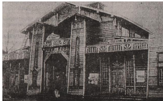
Клуб на фатаграфіі даваенных часоў (“Гомельская праўда”, 1972 год)

разваротная пляцоўка гарадскіх аўтобусаў каля аўтавакзала.