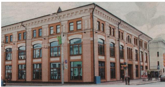
На месцы Старога ўнівермага размяшчалася гасцініца “Савой”

У першапачатковай якасці “Савой” праіснаваў зусім нядоўга: з 1920-га па 1923 год на першым паверсе — Палац працы, у 1923-м — гомельская кантора “Доброфлота”, пазней — Гомельскі выканаўчы камітэт. За нядоўгія гады існавання будынка яно пацярпела не аднойчы: у 1918 годзе — у рэстаране гасцініцы, дзе знаходзілася германскае камандаванне, адбыўся выбух, які арганізавапі мясцовыя падпольшчыкі, у 1919 годзе ў ходзе Стракапытаўскага мяцяжу будынак быў абстраляны гарматамі; у 1941-м падчас авіяналёту германскай авіяцыі выгаралі перакрыцці, былі часткова разбураны апорныя сцены будынку.