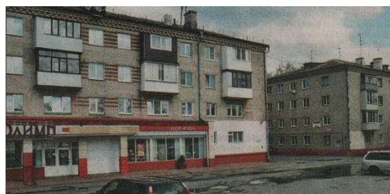
У двары паміж гэтымі дамамі размяшчаўся “палац”

Гэтая пабудова знаходзілася паміж жылымі дамамі ваенных 63-й асобнай авіяцыйнай эскадрыллі,