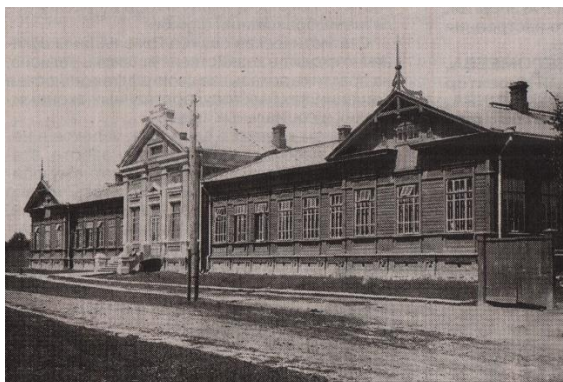
Школа чыгуначнікаў на фатаграфіі 1930-х гадоў

Падчас нямецкай акупацыі ў школе размяшчаўся лазарэт. Да вызвалення Гомеля будынак быў спалены. У выніку ад яго застаўся толькі каменны фасад, які пасля быў знесены. У 1960-х гадах на месцы будынка была ўзведзена новая трохпавярховая школа па тыпавым праекце.