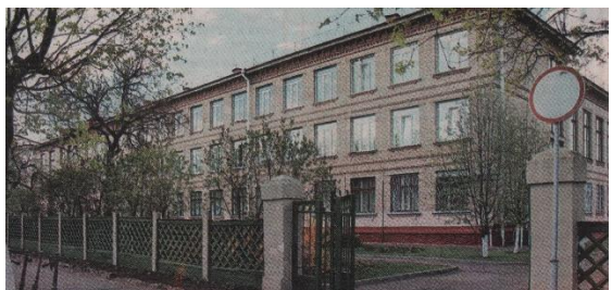
На гэтым месцы размяшчалася школа чыгуначнікаў

На скрыжаванні вуліц Хмяльніцкага і Кіеўскай размешчаны буйны драўляны будынак былой школы, дэкор якой мае падабенства з упрыгожваннямі школы для дзяцей чыгуначнікаў.