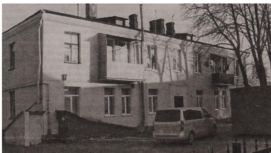
На гэтым месцы размяшчаліся цэнтральныя лазні