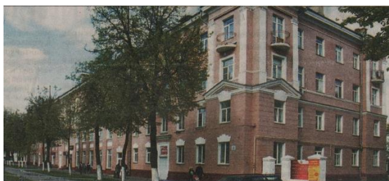
На гэтым месцы быў будынак сталовай

Гэты стылёвы канструктывісцкі будынак знаходзіўся на вуглу