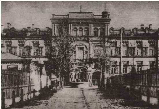
Цэнтральныя лазні на паштоўцы пачатку ХХ стагоддзя (з кнігі В. Целеша "Парады Беларусі на старых паштоўках")

Сёння на гэтым месцы знаходзіцца сціплы двухпавярховы будынак, які ўзведзены ў 1960-х гадах.