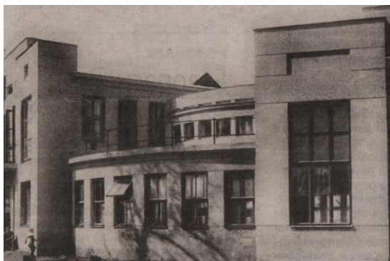
Сталовая ў рабочым пасёлку (Новая-Беліца)

У першыя гады індустрыялізацыі ў Навабеліцы вакол буйных прадпрыемстваў былі пабудаваны некалькі працоўных пасёлкаў. Жылыя дамы-кваталы, якія адносяцца да аднаго з такіх заводаў, былі размешчаны на вуліцы Ільіча (у той час вуліца Шасэйная). Побач з двума шматкватэрнымі дамамі ў 1930 годзе пабудавалі сталовую-рэстаран.