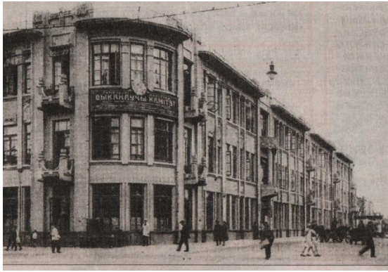
Гасцініца “Савой” на паштоўцы 1930-х гадоў