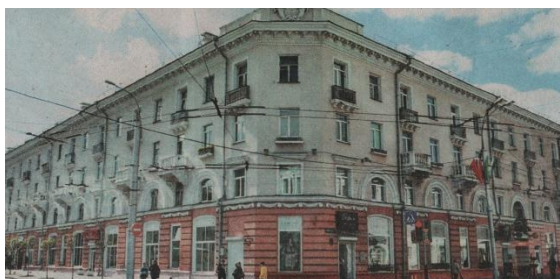
На гэтым месцы размяшчалася духоўнае вучылішча