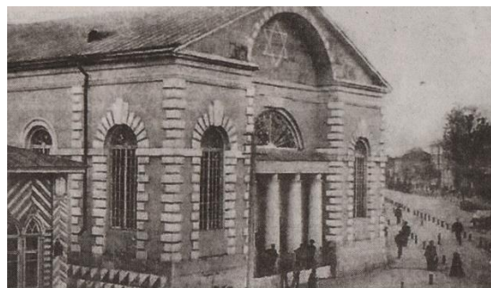
Сінагога на паштоўцы пач. XX стагоддзя

У пісьмовых крыніцах габрэйскае насельніцтва ў Гомелі ўзгадваецца з XVII стагоддзя. У пачатку XIX стагоддзя граф Мікалай Румянцаў садзейнічаў узвядзенню ў горадзе культовых пабудов — праваслаўных цэркваў і касцёла. У 1833 годзе была пабудавана і сінагога. Размяшчаўся будынак на скрыжаванні вуліц Працоўнай (Базарнай) і Кірава (Магілёўскай). Вялікі руставаны будынак з франтонам, разрэзаным аркай, быў пабудаваны ў стылі класіцызму. Як важныя культуры будынак ён замыкаў перспектыву вуліц Базарнай і Мясніцкай (Камунараў).