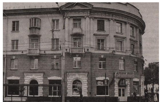
На гэтым месцы размяшчалася гімназія Ратнера

У гады вайны былая гімназія пацярпела адудараў нямецкай авіяцыі. Як і ў большасці будынкаў у цэнтры горада, у ім выгаралі міжпавярховыя