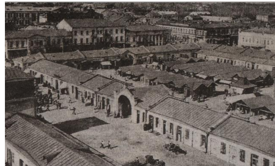
Гандлёвыя рады. Базарная плошча

У гады вайны гандлёвыя рады яшчэ раз пацярпелі ў выніку бамбёжкі ўлетку 1941 года, і на момант вызвалення горада ад пабудоў нічога не засталася.