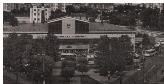
На гэтым месцы размяшчаўся клуб чыгуначніка