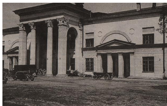
Будынак “палаца” на нямецкай фатаграфіі 1941-1943 гадоў

Адзін з самых малавядомых будынкаў Гомеля размяшчаўся на вуліцы Савецкай паміж вуліцамі Шылава і Чангарскай дывізіі. Ніякай інфармацыі аб яго прызначэнні не захавалася. Магчыма, з-за таго, што яно праіснавала зусім непрацягла тэрмін — не больш за дзесяць гадоў. Толькі нешматлікія фотаздымкі, зробленыя нямецкімі акупантамі, праліваюць святло на гэтую пабудову: пампезны двухпавярховы будынак адступаў ад чырвонай лініі вуліцы Савецкай, утвараючы пляц. Тры порцікі афармлялі парадны ўваходы на галоўным фасадзе. Як і ў выпадку з корпусам універсітэта імя Францыска Скарыны, што размешчаны на вуліцы Кірава, на аўтара гэтай пабудовы канца 1930-х гадоў, верагодна, паўплывала архітэктура італьянскіх папацаў эпохі Адраджэння.