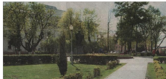
Месца, дзе былі гандлёвыя рады. Сёння сквер імя Кірылы Тураўскага