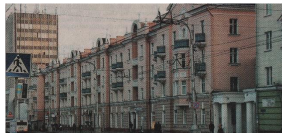
На гэтым месцы размяшчаўся цырк

У 1952 годзе вядомы мінскі архітэктар Уладзімір Кароль на гэтым месцы пабудоваў манументальны чатырохпавярховы жылы дом у стылі савецкага класіцызму.