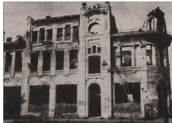
Будынак гімназіі Ратнера пасля вызвалення Гомеля ў 1943 годзе (з фондаў Гомельскага палацава-паркавага ансамбля)