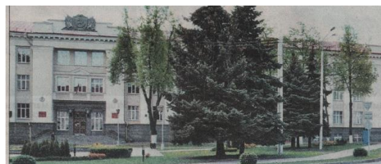
На гэтым месцы ў скверы перад будынкам дарожна-будаўнічага каледжа размяшчалася сінагога

У пачатку 1920-х гадоў працоўныя прафсаюзы прынялі рашэнне аб канфіскацыі будынка сінагогі ў іўдзейскай абшчыны і перадачы для патрэб грамадскасці. У 1923 годзе сінагога была зачынена, у яе памяшканнях размясцілася зала гарсавета, а таксама клуб швейнікаў. У выніку перабудовы знікла рустоўка, канструктывісцкі атык замяніў франтон.