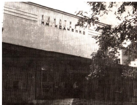
Детский кинотеатр имени А. Исаченко находился справа от входа в центральный парк.