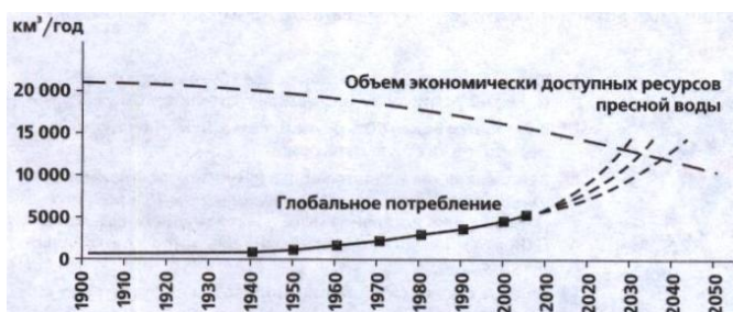
Рис. 3. Изменение со временем доступных запасов пресной воды (с учетом их снижения из-за загрязнения) и потребности в ней

которых лишь 2,5%, т. е. около 35 млн. км 3 , приходится на пресную воду. Большая часть запасов пресной воды сосредоточена в многолетних льдах и снегах Антарктиды и Гренландии, а также в глубоких водоносных горизонтах, а главными ее источниками остаются озера, реки, почвенная влага и неглубокие резервуары подземных вод. Доступная для эксплуатации часть этих ресурсов оценивается примерно в 200 тыс. км 3 - менее 1% запасов пресной воды и лишь 0,01% всей воды на Земле. Ситуация усугубляется тем, что значительная их доля размещена вдали от населенных территорий.