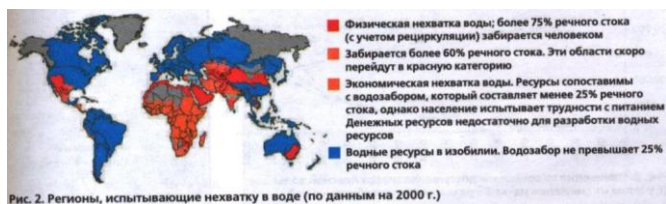
Рис. 2. Регионы, испытывающие нехватку в воде (по данным на 2000 г.)

надежда на то, что все проблемы питьевого водоснабжения можно решить техническим путем на станциях водоподготовки, хотя даже с чисто экономической точки зрения во многих случаях гораздо эффективнее охранять воду в источнике, чем «очищать» на станциях водоподготовки.