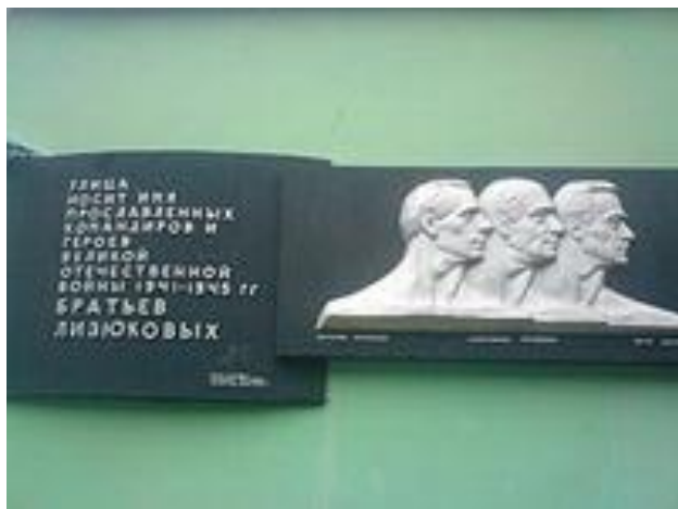
Мемориальная доска в Гомеле на улице Братьев Лизюковых.