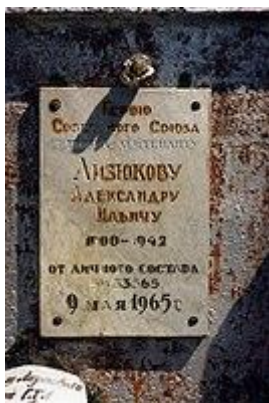
Памятник генералу А. И. Лизюкову в селе Медвежье, Россия.

Надпись на памятнике: «Генералу Лизюкову в Медвежьем: «Герою Советскому Союзу генерал-лейтенанту Лизюкову Александру Ильичу 1900-1942 от личного состава в/ч 33565. 9 мая 1965 г.»