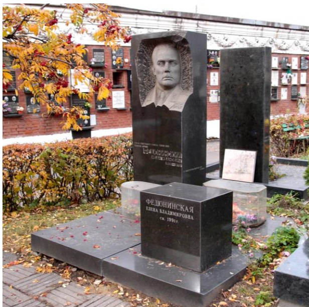
Памятник на могиле Федюнинского И. И. на Новодевичьем кладбище