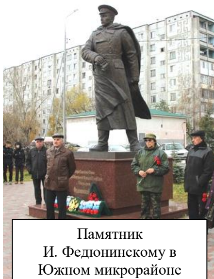
Памятник И. Федюнинскому в Южном микрорайоне Тюмени