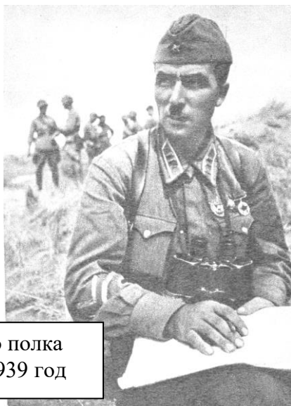
Командир 24-го моторизованного полка И. И. Федюнинский. Халхин-Гол, 1939 год

Во всех сложных случаях Иван Иванович Федюнинский умел находить правильное решение, а когда началось генеральное наступление наших войск, полк под его командованием победоносно вёл бой.