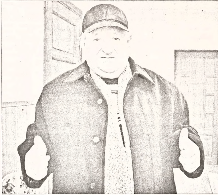
• Да 75-годдзя з дня нараджэння

– Нарадзіўся я 1 студзеня 1948 года ў вёсцы Гута Рагачоўскага раёна. Гэта каля Журавіч. Бацькі – вясковыя настаўнікі, Вольга Якаўлеўна Тарасова і Юрый Трафімавіч Ткачоў. Прозвішчы розныя таму, што маці, як скончыла педінстытут ды атрымала дыплом, дык перапісваць