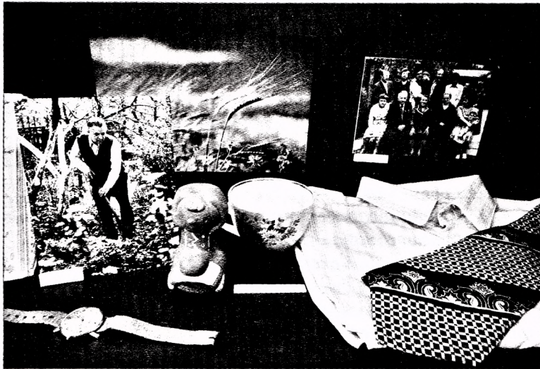
Асабістыя рэчы Івана Шамякіна ў экспазіцыі Літаратурнага музея пісьменнікаў Гомельшчыны.

Рэалізацыя праекта стала магчымай дзякуючы цеснаму супрацоўніцтву бібліятэкі з роднымі і блізкімі пісьменнікаў. У выніку карпатлівай, штодзённай працы нам пашчасціла атрымаць многія музейныя экспанаты, якія існуюць толькі ў адным экзэмпляры. Дастаткова назваць такія цікавыя рарытэты, як залікоўка студэнта БДУ Івана Мележа, датаваная 1943–1944 гг., з выключна выдатнымі адзнакамі; лісты дачкі Людмілы бацьку ў Ялту. Як вядома, пісьменніку часта даводзілася выязджаць на лячэнне да мора, і дзеці сумавалі. Вельмі шчымліва чытаць: “Милый папа, мои отметки 4 и 5. Скорее приезжай. Целую. Людмила. 1951 год”. Альбо ліст бацькі Паўла Фёдаравіча сыну са словамі ўдзячнасці за матэрыяльную дапамогу. Асаблівае месца адведзена ў нашай экспазіцыі друкарцы, якая, па словах дачкі Ларысы, вандравала з пісьменнікам паўсюдна. Яшчэ адзін унікальны экспанат, што захаваў для гісторыі і для нас подпісы ўсіх членаў Саюза пісьменнікаў таго часу, – прывітальны адрас