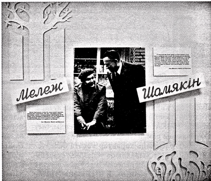
Дамінантная частка экспазіцыі, візуальная спасылка на герояў і кнігу “Карэнні і галіны” І. Шамякіна (Мінск, 1986), у якой апублікаваны артыкул “Палёт над Палессем”.

...Іван Мележ, скончыўшы дзесяцігодку з залатым медалём, паступіў, хоць не з першага разу, у Маскоўскі інстытут філасофіі, літаратуры і гісторыі імя М. Чарнышэўскага. У гэты ж час адбываецца дэбют 18-гадовага пачаткоўца ў друку: верш “Радзіме” апублікаваны на старонках газеты “Чырвоная змена”.