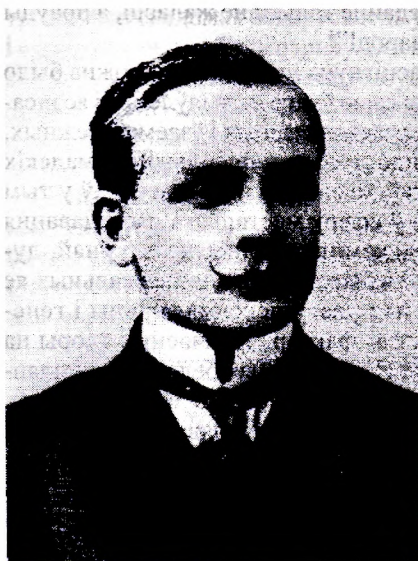
Янка Купала. 1911 г.

Янка Купала разам з магутнай плеядай пісьменнікаў-адраджэнцаў на пачатку ХХ ст. заклалі трывалы падмурак беларускай класічнай літаратуры. Постаць прарока беларускага адраджэння асветлены і ўвесь цяжкі шлях да дзяржавабудаўніцтва і нацыятворчасці, што і на золку новага тысячагоддзя не страчвае сваёй лёсавызначальнай сутнасці і актуальнасці. Волат беларускага духу стаяў ля вытокаў новага мастацкага і планетарнага мыслення, якое сінтэтычна ахоплівала ўсе сацыяльна-побытавыя і быццёвыя перыпетыі жыцця – з усімі складанымі – падчас драматычнымі, падчас трагічнымі – яго метамамарфозамі, поліфанізмам і шматтраннасцю праяў. Паэт, кіруючыся высакароднай задачай – спраўдзіць ідэал нацыянальнага дзяржаўнага будаўніцтва Беларусі, стварыў маштабную карціну нацыянальнага быцця, выявіў невычэрпныя духоўныя магчымасці народа, па-мастацку пераканальна засведчыў яго прагу духа і светаспазнання, яго вечнае парыванне жыць у вольным грамадстве. Адною з найгалоўнейшых была задача выявіць сутнасць змест эпохі, раскрыць шмат’ёмістую сістэму жыццёвымярэнняў, спрыяць крышталізацыі, фармаванню самасвядомасці асоб-