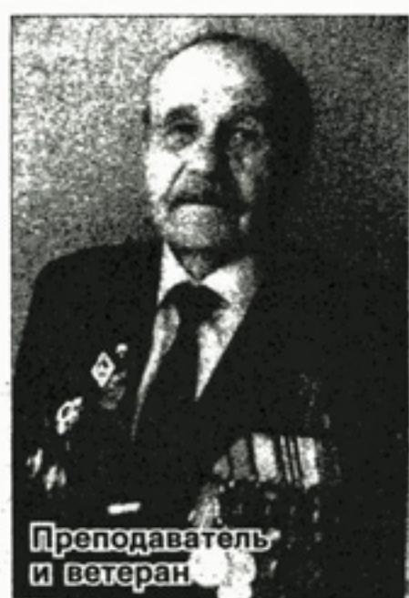
Преподаватель и ветеран

Немцы, по словам Георгия Саввича, редко ходили в рукопашную — боялись наших штыковых атак. «Видно, с суворовского времени у русского солдата осталось это качество. А у немцев на дулах винтовок были штыки-тесаки. Так что и нам расслабляться