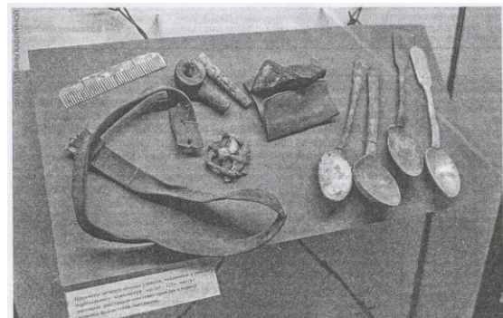
Находки с места концлагерей — немые улики фактов геноцида.

С сентября 1941-го по 10 октября 1943-го в Дулаге-121 уничтожили свыше 100 тысяч человек. Часть из них хоронили прямо в лагере — в месте, где до этого находилось стрельбище. Позже тела стали вывозить в противотанковый ров за городом. Уже после войны во время раскопок количество определяли примерно, рассчитывая по формуле, с учетом размеров и плотности захоронений. Идентифицировать кого-либо было невозможно.