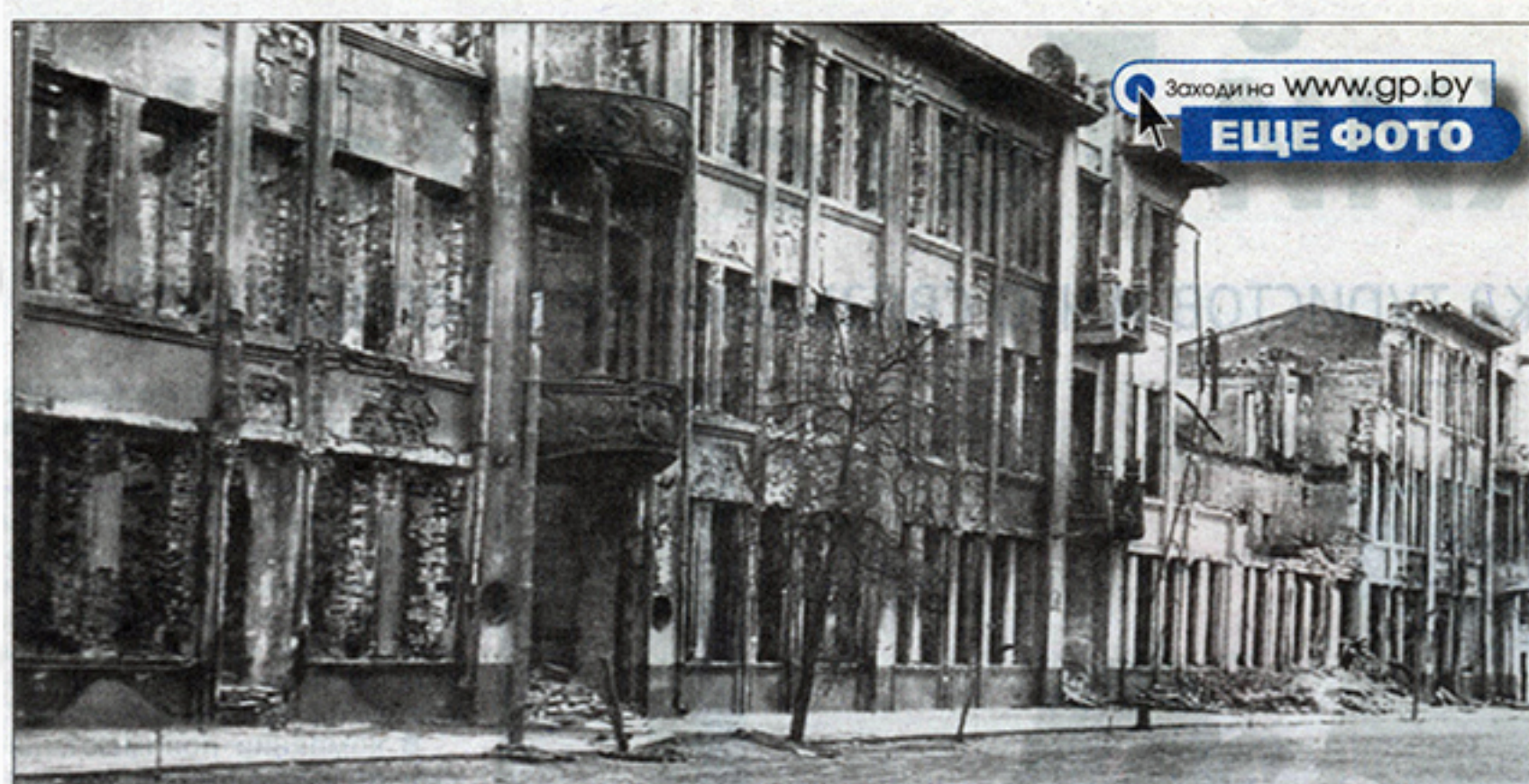
Улица Коммунаров после освобождения Гомеля