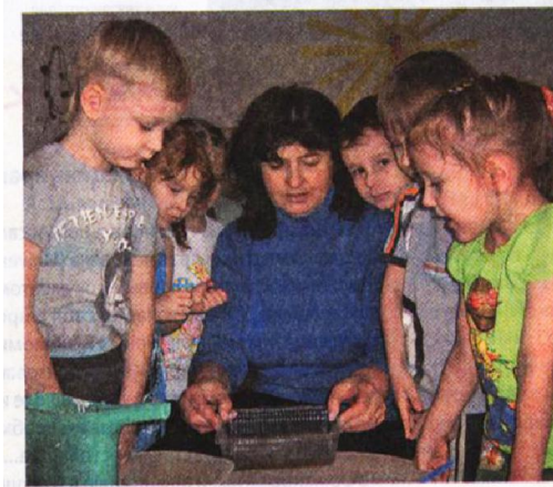
Фото 2. А вот и результат!