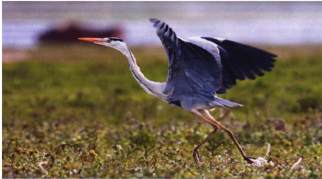
Шэрая цапля харнуецца на высах Тураўскага луга (Гомельская вобласць)