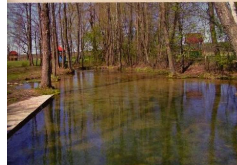
На севере из водоема вытекает ручей