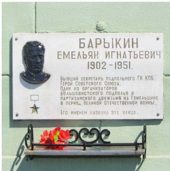
Памятная доска, Гомель, ул. Барыкина, 1