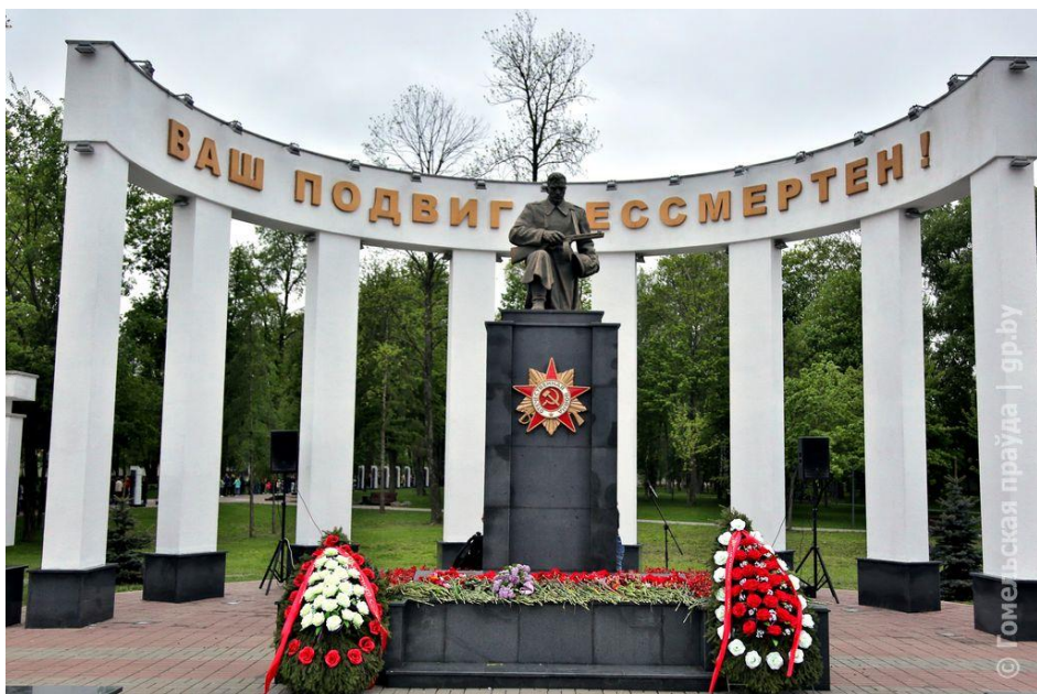
Гомель, Аллея Героев