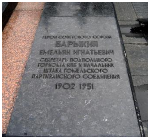
Надгробная плита, Гомель, Братская могила